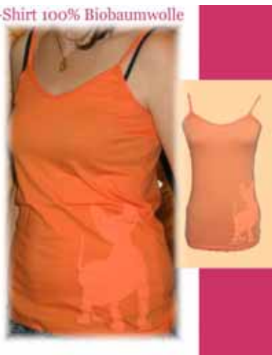
T-Shirt 100% Biobaumwolle

Top in kräftigem Orange mit geflochtenen Trägern und Verzierung am Ausschnitt, Größen S,M,L, Bestellnr. SS/39 Preis € 39,90