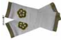
Armstulpen in weiss mit farbigen Bündchen, und Häkelblume €19,90